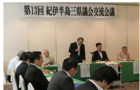
紀伊半島三県議会交流会議の様子

会議では、「医師確保に向けた取り組み」と「紀伊半島における道路ネットワークの整備促進」について、意見交換が行われました。その結果、必要となる財源の確保等について三県が連携し、国に対して要望していくことが合意されました。