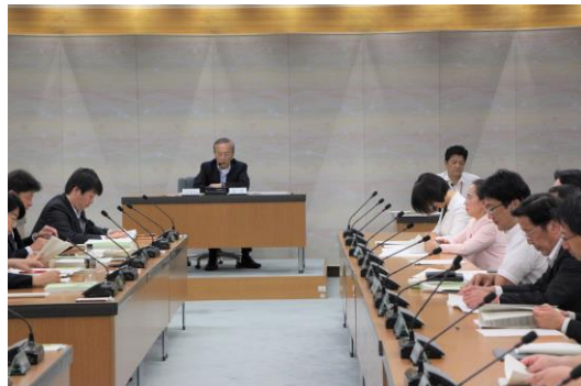
議会改革推進会議総会の様子