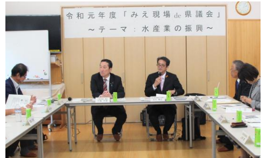
第1回「みえ現場 de 県議会」の様子

令和元年度の第1回目は、11月7日に尾鷲市早田コミュニティセンターで、「水産業の振興」をテーマに開催しました。当日は、早田漁師塾に関わっている方や漁業の振興に関心のある方々と早田漁港を視察した後、水産業の今後の課題などについて意見交換を行いました。