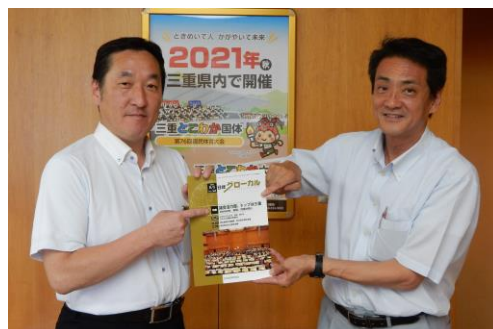
議会活力度調査結果を示す正副議長

分野別では、「議会運営」で1位となり、議会基本条例を都道府県で初めて制定したこと、県政の重要課題について県民や関係団体と意見交換する「みえ現場de県議会」、学校へ講師として議員が出向く「出前講座」、高校生が県議会を体験する「高校生県議会」の開催などの取組が評価されました。