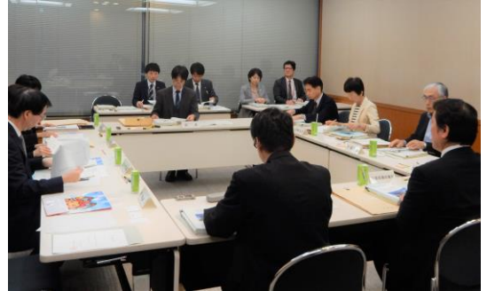
選挙区及び定数に関する在り方調査会の様子