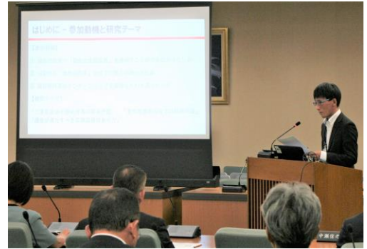
インターンシップ実習生報告会の様子

令和元年度は、9月に三重大学大学院の学生を実習生として受け入れました。実習生は、9日間に渡り、県議会や県議会議員の役割等について学び、実習の成果を発表する報告会では、議会に対し、「議会改革と広聴広報」というテーマでみえ現場 de 県議会のスケールアップという政策提言をしました。