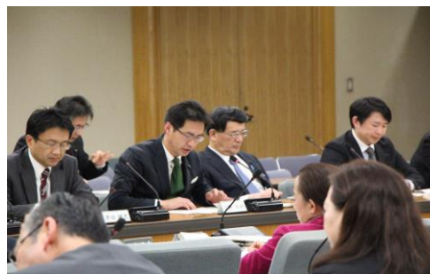
議会経費削減に関する検討プロジェクト会議からの検討結果報告

この検討結果に基づき、本年3月に議員報酬および政務活動費を4年間削減する関係条例の改正が行われ、同年5月より削減が始まりました。