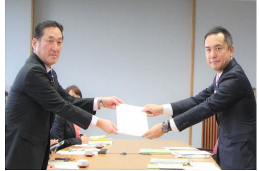
知事への申し入れの様子