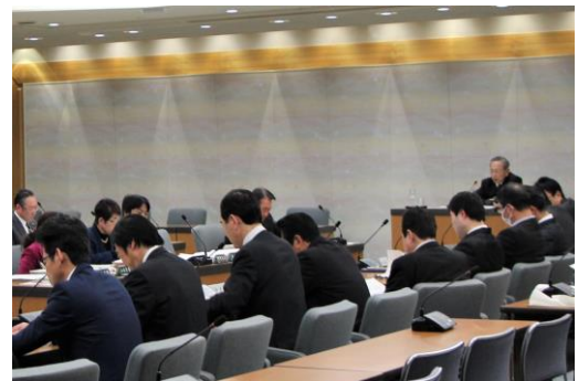
議会改革推進会議総会の様子

その中で、4年間の取組を評価するとともに、改選後議会に向けて、引き続き、議会活動計画を策定し、計画的な議会活動の実施・評価を行っていくこと、課題とされた個別項目への対応について検討していくことなどを提言しました。