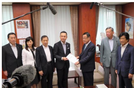
農林水産大臣に直接要望

さらに、飼養豚への予防的ワクチン接種が実施されることとなったことを受けて、本年10月には「豚コレラ対策の更なる強化を求める意見書」を全会一致で可決し、国関係機関等へ提出しました。