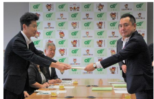
知事への申し入れの様子

その中で、誰もが安心して暮らすことができる社会づくりに向け、実効性のある取組を展開することや、持続可能な財政基盤の確立をめざし、引き続き財政運営の改革に取り組むことなどを要望しました。