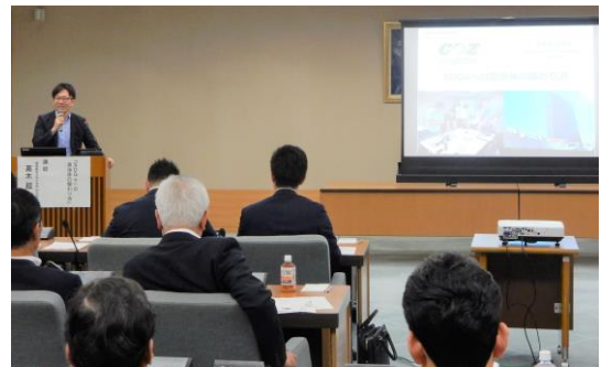
議員勉強会の様子

全議員を対象に、専門家にご講演いただき、議員間における共通認識の醸成と更なる理解の向上を図りました。