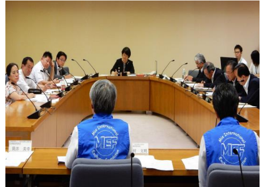
外国人労働者支援調査特別委員会の様子