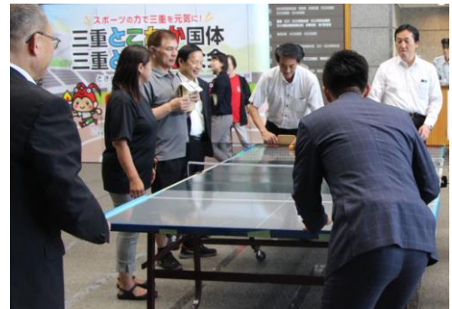
SSピンポン議員体験会の様子