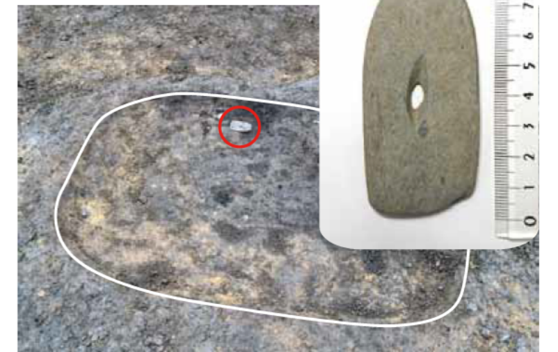
土坑4(北から) 長径約1.4m。赤丸の位置から中央に穴のあけられた板状の石製品が出土しました。板状の石製品はきれいに磨かれており、装身具の可能性も考えられます。