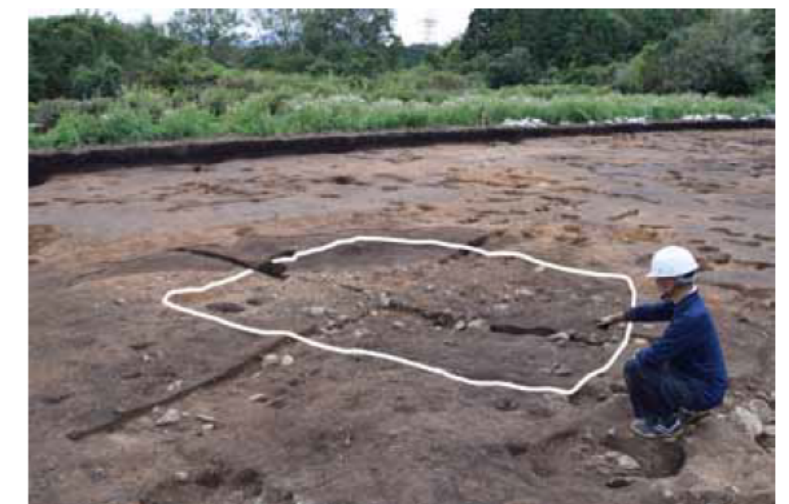
竪穴建物4(南東から) 弥生時代中期の竪穴建物です。3.3×3.8mの方形で弥生土器の破片などが出土しました。空畑遺跡で初めてみつかった弥生時代の遺構です。