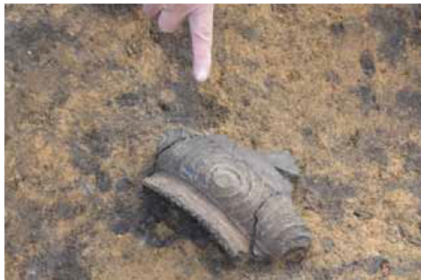
土坑5から出土した縄文土器 北白川下層Ⅲ式（関西系）の土器です。