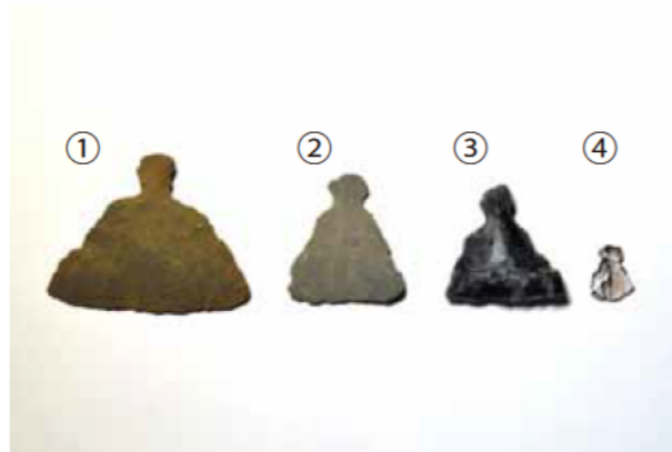
石匙（いしさじ） 石で作られた携帯用のナイフと考えられています。 石材：①②サヌカイト、③チャート、④黒曜石