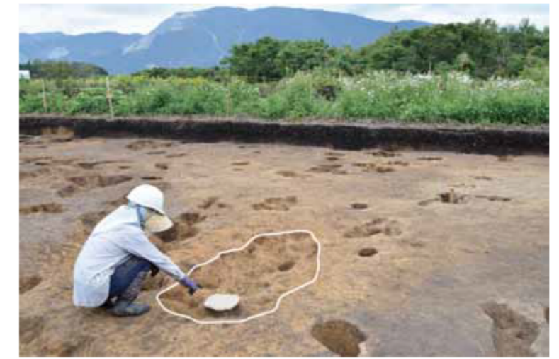
土坑1(東から) 長径約2mの楕円形の穴です。穴の東側から石皿が出土しました。