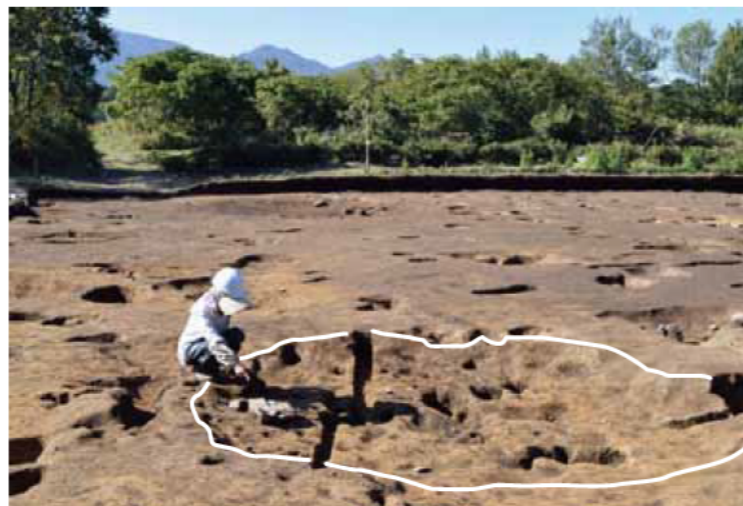
竪穴建物3(東から) 直径約4mの円形をしています。石皿が出土しました。