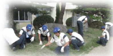
『事業者』のアクション