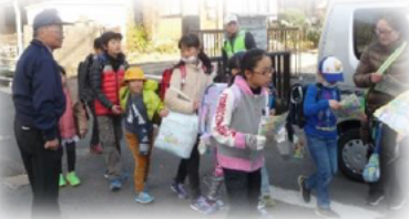
『県民』のアクション

…（重点テーマごとに）県民・事業者の皆さんに「期待するアクションの例」を掲載しています。