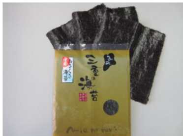
アサクサノリの製品