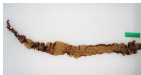
選抜育種で作出したアサクサノリ養殖株