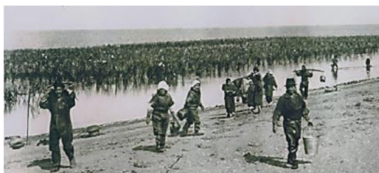
昭和20年代 三重県村松海岸で養殖されているアサクサノリ