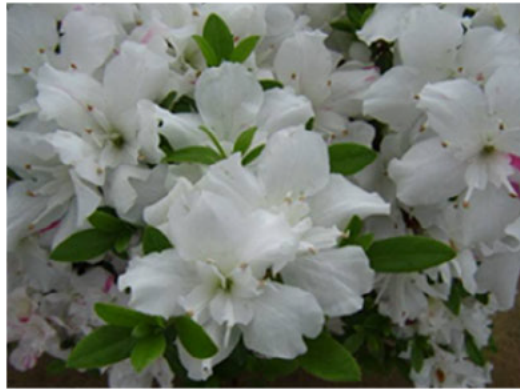
開花株の花の様子