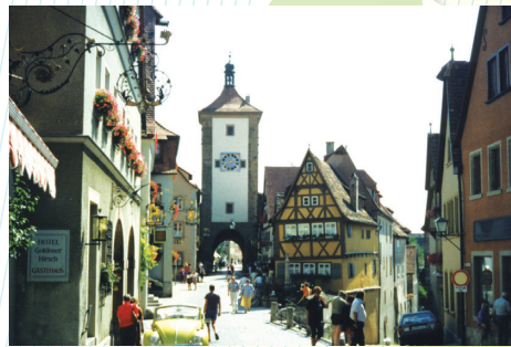
ドイツ(ローテンブルク)