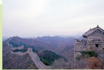
中国(万里の長城)