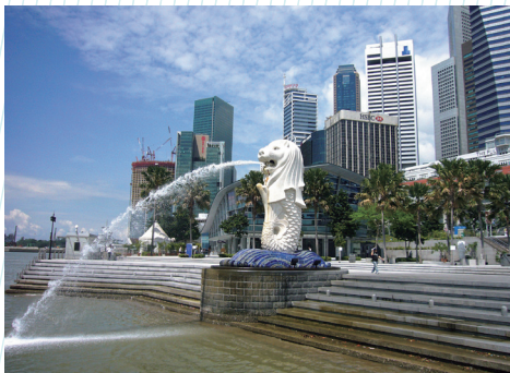
シンガポール(マーライオンパーク)