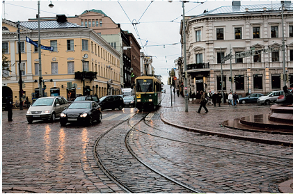
フィンランド(ヘルシンキ)

フランクフルト、ヘルシンキ、デトロイト、ホノルル、ソウル、北京、香港、バンコク、グアム、アブダビなど世界27都市へ就航 ※平成26年4月1日現在