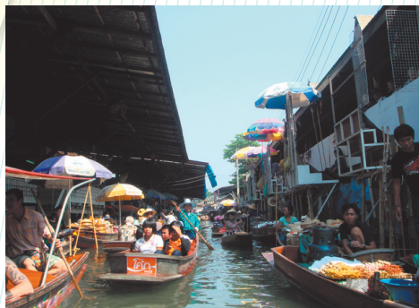
タイ(バンコク 水上マーケット)