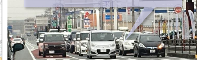
【所要時間の変化（左図：大口町南～大塚町間）】