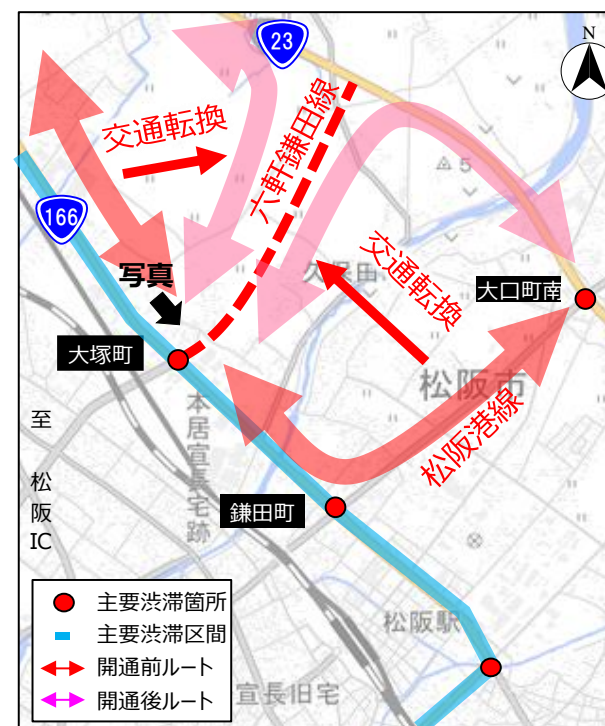
【写真：大塚町交差点】