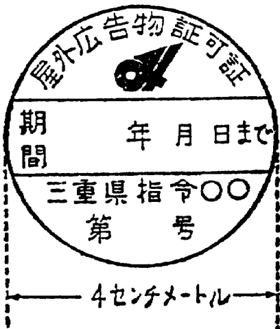
屋外広告物許可押印