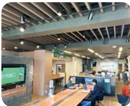
▲フリーアドレスのオフィス 効率改善のアイデアと遊び心が詰まっている