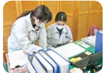
▲女性現場監督による女性現場事務スタッフへの研修