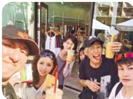
▲プチコミファミリー制度での海外旅行