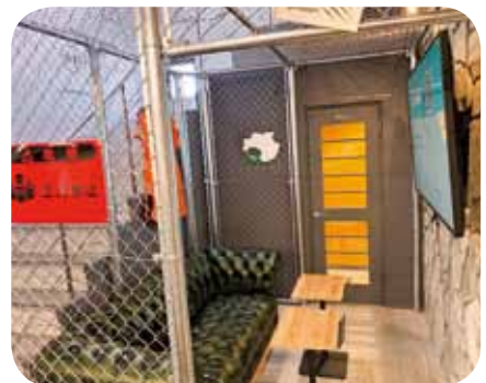
▲作業やWEB会議に集中できる 「60分集中Room」