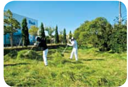
▲緑地整備活動を14年間実施