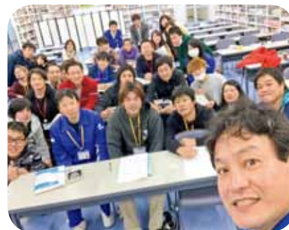
▲社長自ら講演する次世代養成塾