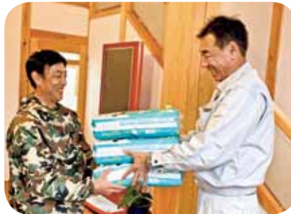
▲育児休業者へプレゼント