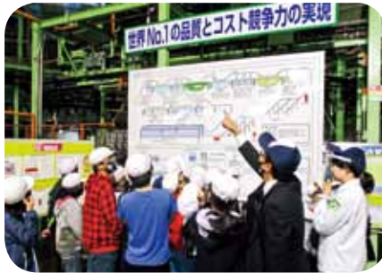
▲小学校工場見学 (令和2年度は5校、470名を受入)