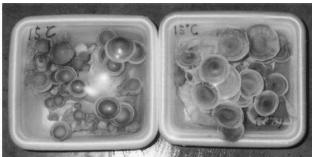
写真 - 1 . 1 5 7日目の保存状況