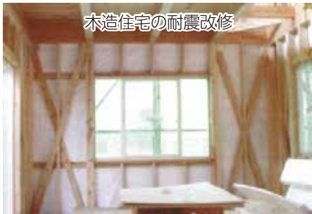
木造住宅の耐震改修

戸別訪問等により住宅耐震化を促進するとともに、木造住宅の耐震診断、耐震改修、除却等を支援するほか、低コストの耐震改修工法等の普及を図るため、設計者や施工者向けの講習会を開催します。また、避難路沿道建築物の耐震診断や耐震改修等に対する支援を行います。