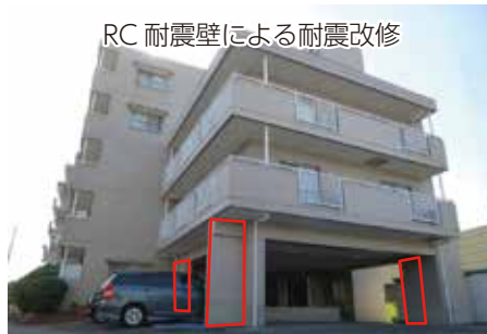
RC 耐震壁による耐震改修