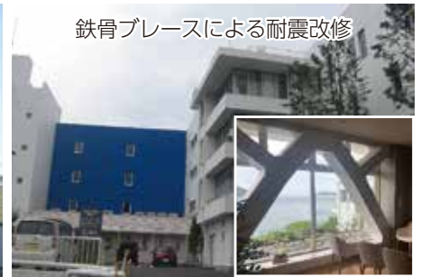
鉄骨ブレースによる耐震改修