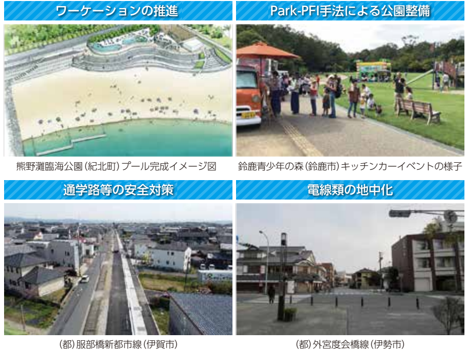
熊野灘臨海公園(紀北町)プール完成イメージ図

地域住民と連携した市町の景観づくりの取組の支援、景観に配慮した建築物や公共施設等への誘導、屋外広告物の設置の適正化や安全対策の充実に取り組みます。