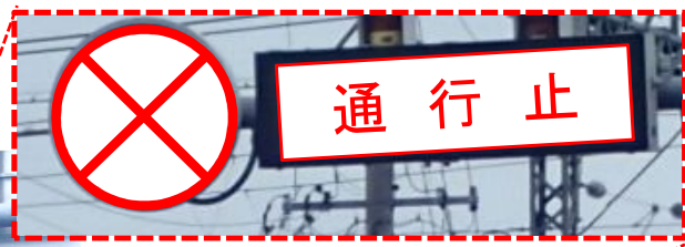
冠水し、通行止めとなった場合