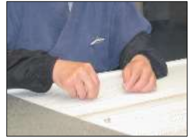
手作りネックレス体験 (イメージ)