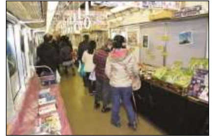
上：観光列車「つどい」 下：マルシェ車内（イメージ）