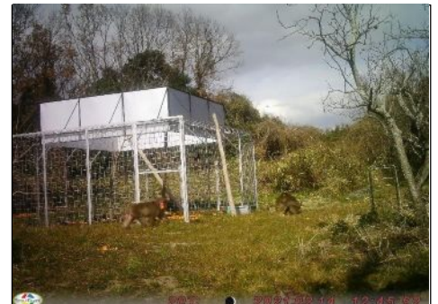
大型サル用地獄檻の作成