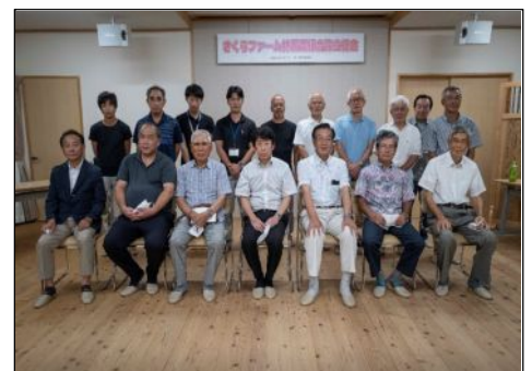
さくらファーム林営農組合設立総会