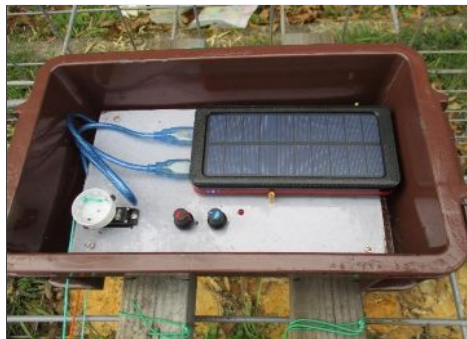
捕獲檻を釣り糸式から センサー式へ変更