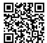
みえにじいろ相談HP