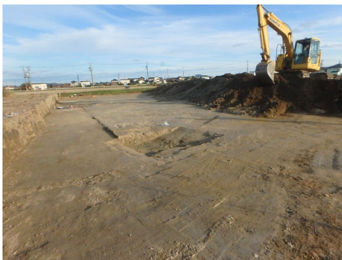
大蓮寺遺跡（第3次）作業風景

今回の調査地は前回調査地の南に隣接しているため、前回のように珍しい遺物が再び出土するかもしれません。今後の調査にご期待ください。