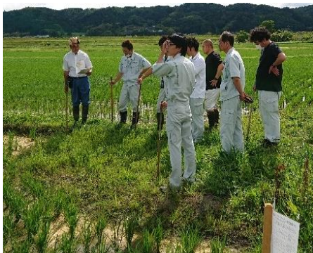
生育基準田運用研修の様子