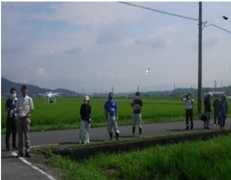
ドローン空撮 現地検証の様子