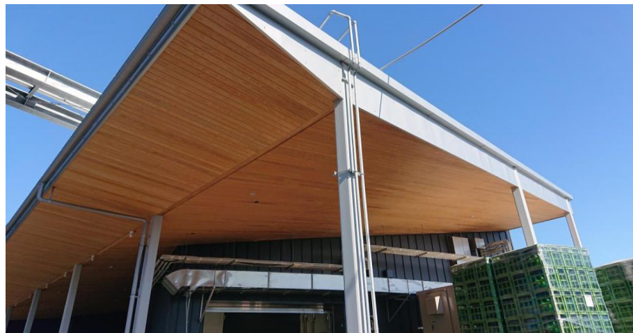
工場 の 軒天

実施時期：令和4年3月 使用箇所：事務所や工場の軒天、建具、家具等 樹種：三重県産スギ、ヒノキ