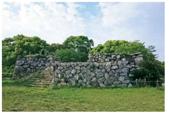
田丸城跡（県指定史跡・玉城町）