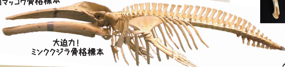
大迫力! ミンククジラ骨格標本