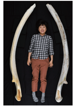
おっきなザトウクジラ下あご