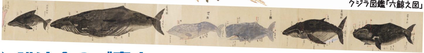
江戸時代のクジラ図鑑「六鯨之図」