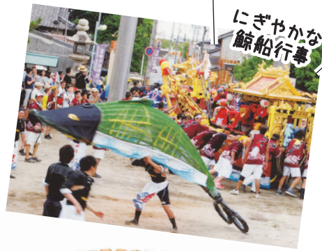
にぎやかな鯨船行事