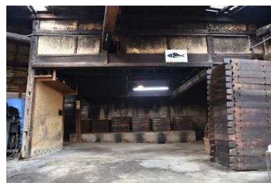
いぶし小屋（北西から）