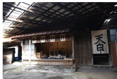
主屋外観（南西から）