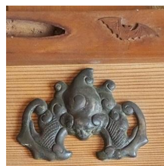
コウモリの釘隠し