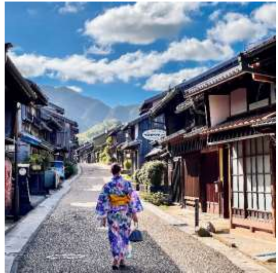
関宿（亀山市） warmcheaptrips 様