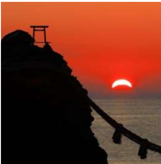
二見興玉神社（伊勢市） a.omori 様