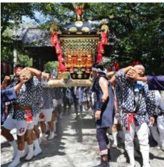
八雲神社（松阪市） machankazu 様