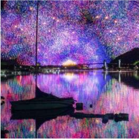
きほく 燈籠祭 (紀北町) good_3_days 様