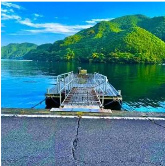
九鬼漁港 (尾鷲市) b_rozenqueen_6624