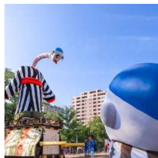
大四日市まつり（四日市市）m5newdo0109 様