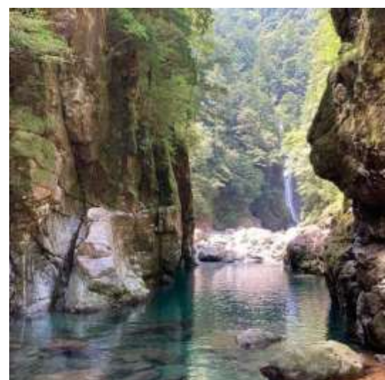
大杉谷溪谷（大台町） barcynyankoskiiii 様