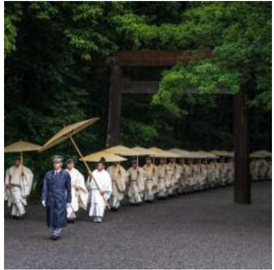
伊勢神宮内宮（伊勢市） ganbaredragons 様