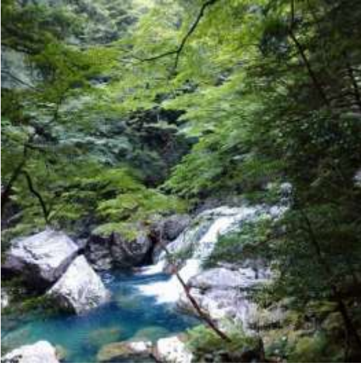
大杉谷溪谷（大台町） takashy_hathaway 様