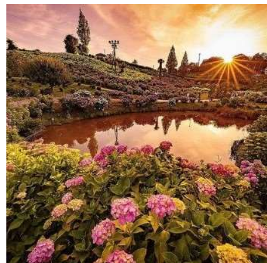
かざはやの里（津市） falcon_w_様