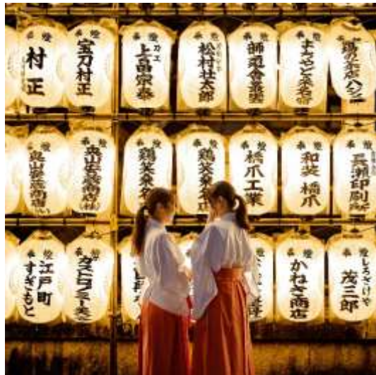
桑名宗社（桑名市）the_mami_trip 様