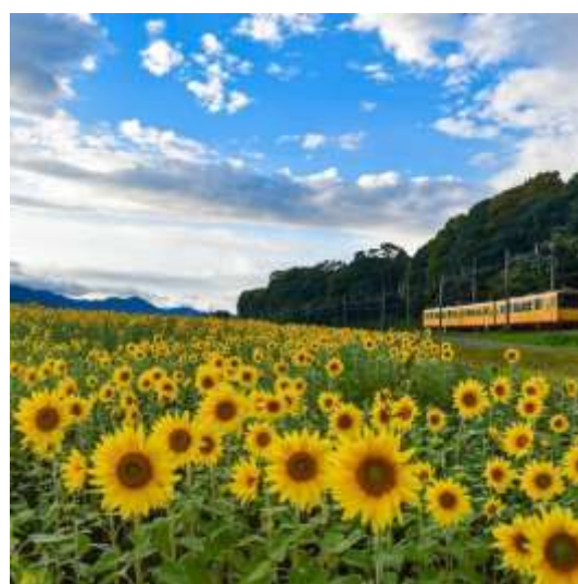
三岐鉄道とひまわり（いなべ市）hitoyasumi__様