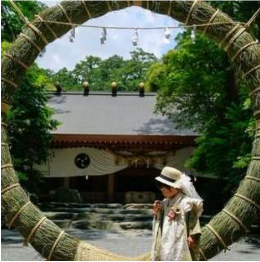
椿大神社（鈴鹿市） e. yama. kandaa 様