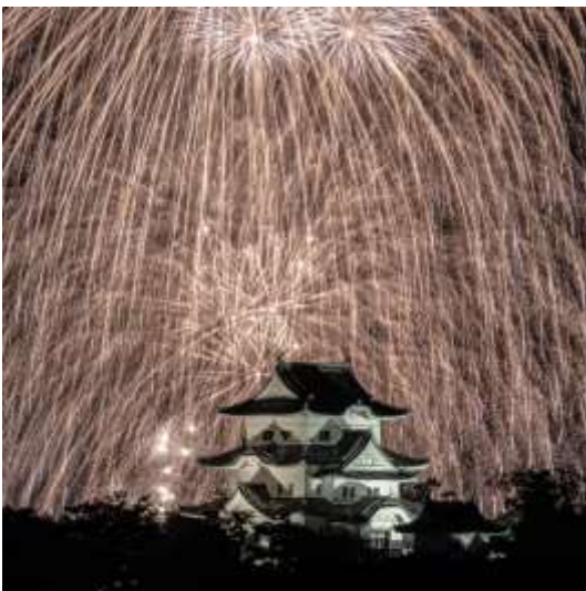
伊賀上野城（伊賀市）