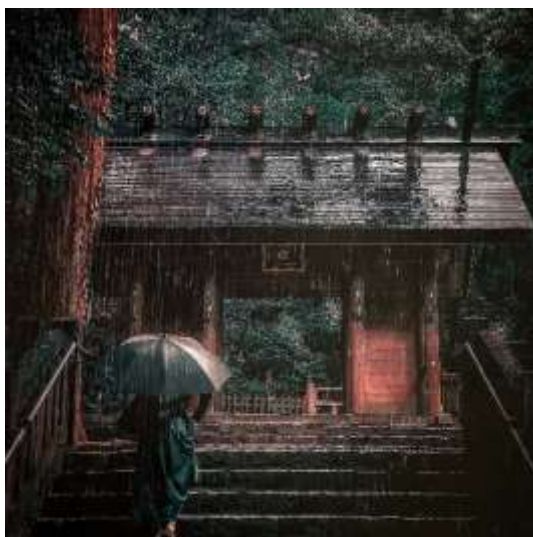
多度大社（桑名市）b_nuts1995 様