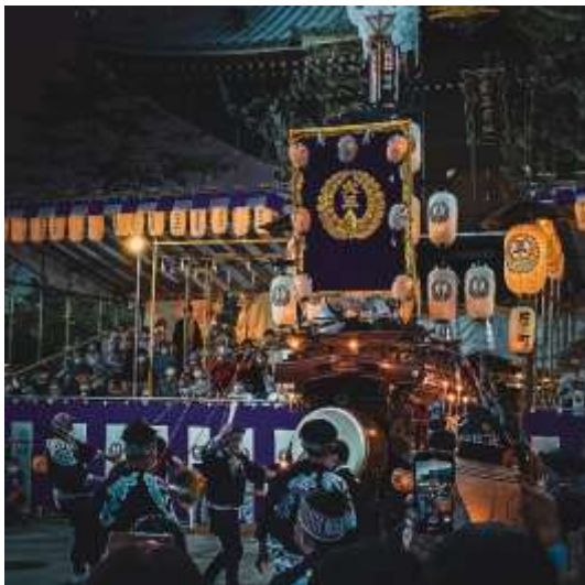
桑名宗社（桑名市）b_nuts1995 様