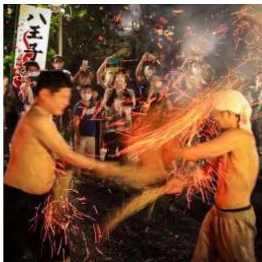
小向神社（朝日町）tanaseda 様