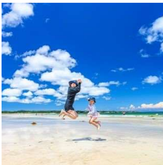
阿児の松原海水浴場（志摩市） kyasunobu 様