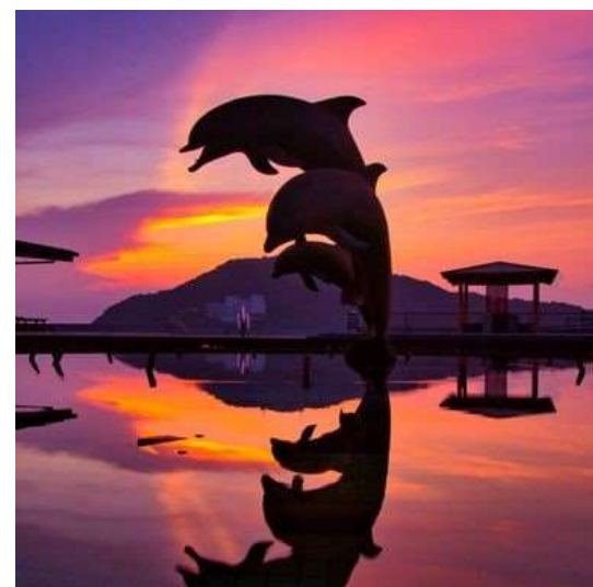
ドルフィン公園（鳥羽市） tsahkiagecchi 様