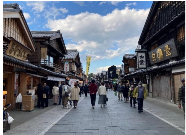
内宮おはらい町地区のまちなみ