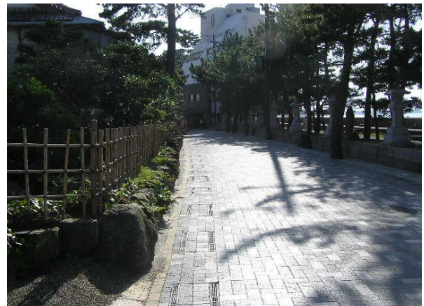
二見町茶屋地区のまちなみ