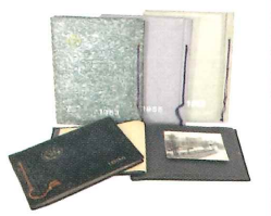
鈴鹿高等女学校・ 亀山高等学校卒業アルバム