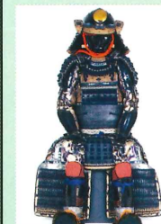
鍔巻包紮糸胸取威 二枚胴具足

展示室に並んださまざまな時代の実物や、復元された古墳、城下町の模型もあります。数十年前まで実際に使われていた道具も展示しています。