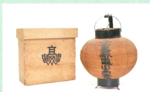
亀山高等学校銘提灯

三重県立亀山高等学校は、令和4年、県立高校となって100年を迎えます。そこで、鈴鹿高等女学校・亀山実業学校などの前身の学校を含め、明治から昭和まで、積み重ねられてきた亀山高校の歴史をご紹介します。