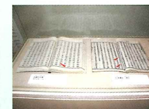
古事記と日本書紀

展示室に並んださまざまな時代の実物や、復元された古墳、城下町の模型もあります。数十年前まで実際に使われていた道具も展示しています。