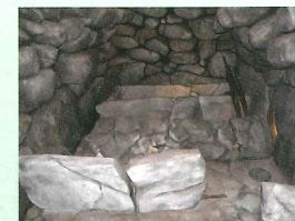
古墳石室の復元模型

常設展示室では、亀山市の通史展示を行っています。小学校・中学校の教科書ともリンクして、地域の歴史を見ることが出来ます。