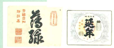
ラベル(薄緑・延年)