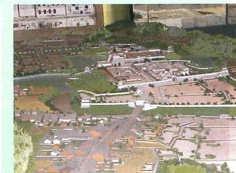
亀山城下町の大型模型