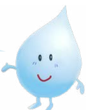
企業庁 マスコットキャラクター みずたまくん