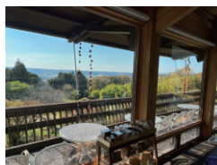
いわむらかずお絵本の丘美術館

里山の自然や生きものに寄りそって生まれた、すてきな絵本の物語。 遊んだり、作業をしたり、絵本の中の自然を体験できるフィールドづくり。 こどもたちの豊かな原体験につながる絵本と場所を生み出した、 いわむらかずおさんによるやさしいおはなし会。 絵本の朗読もあります。