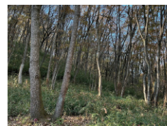
えほんの丘フィールド