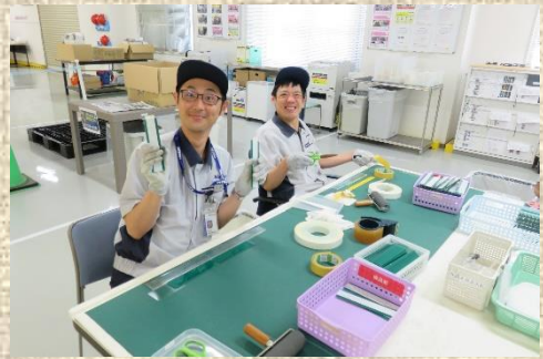
全国アビリンピックの様子