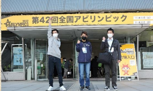
令和4年11月5日（幕張メッセ）