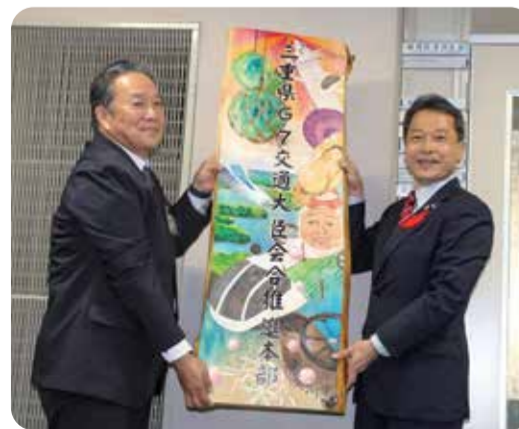
(左) 野呂雇用経済部長 (右) 一見知事

雇用経済部入口前(県庁8階)に、県産ひのきを使用した「三重県G7交通大臣会合推進本部」の看板を設置。県立志摩高等学校美術部の皆さんに制作していただきました。