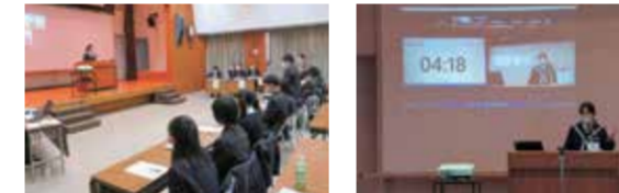
高校生の部 中学生の部