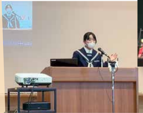
第四次三重県子ども読書活動推進計画 Q検索

今号は、子どもが読書に親しみ、読書習慣を身につけるため、県が推進する取り組みを紹介します。