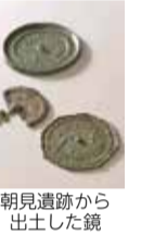
朝見遺跡から出土した鏡

期間 3月11日(土)～4月23日(日) ※月曜休館 時間 9時～17時 場所 県総合博物館3階 三重の実物図鑑 料金 無料 県内で行われた発掘調査の成果をいち早く紹介する特集展示 を開催します。 問 県総合博物館(MieMu) みえむ 埋蔵文化財 Q検索 TEL 059・228・2283 FAX 059・229・8310