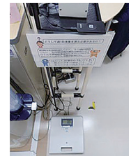
体重管理システム