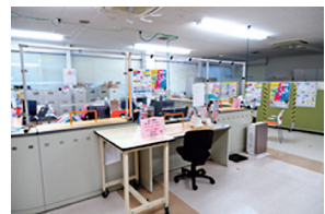
健康推進室による受診勧奨