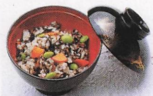
あらめの混ぜご飯 →P187