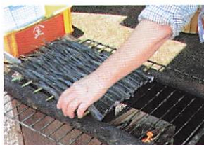
串を炉の上の網に並べていく