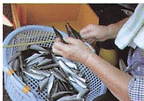
頭を落とし内臓を洗って塩をした魚を串に刺す