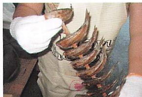
美しいべっ甲色に仕上がりました