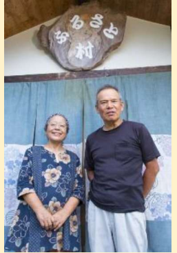
体験民宿オーナーご夫妻

森林と川・海が共存する大紀町では、自然を活かした様々な産業（例：農林漁業、商業、観光業など）が存在し、移住してきた人たちも活躍できる環境があります。