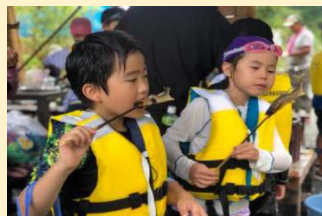
川体験 アユツーリズム