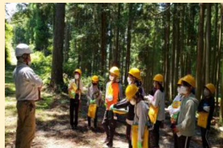
森林体験 森林学習