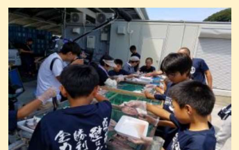
漁業体験 干物作り