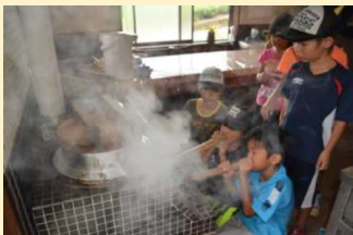
体験民宿 釜戸でご飯作り