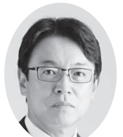
昭和三十五年六月十七日生(六二歳)