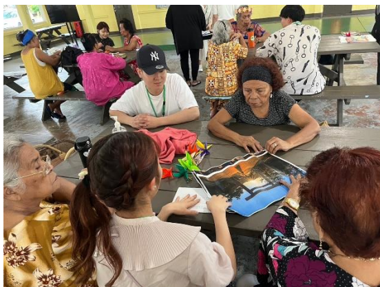
伊勢神宮についての紹介

・実施内容：同施設に通われている年配の方に伊勢神宮や伊賀忍者の写真を見せながら歴史、文化、伝統を中心とした三重県の概要を説明しました。また、三重県の特産物の一つである伊勢茶を持参し、現地にて水出しでティーバッグからお茶を淹れ皆さんに試飲をしてもらいました。