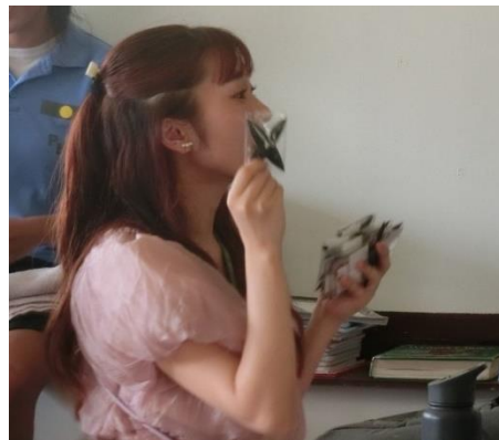
伊賀忍者の手裏剣の紹介