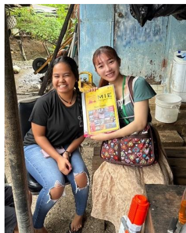
三重県のパンフレットを提供