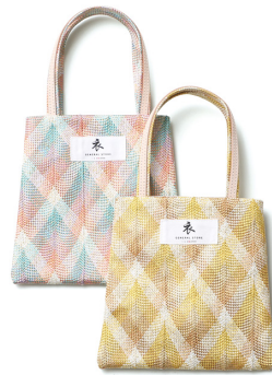
伊賀くみひも ミニトートバッグ