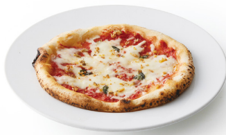
三重の食材で作った “Re:ミックスピザ”