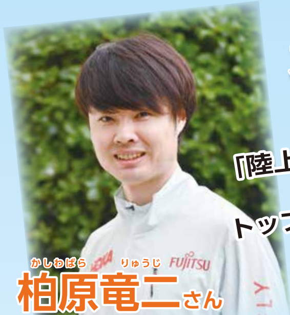
かしわばら 柏原竜二 さん

「陸上」と「レスリング」 垣根を越えた トップアスリートの2人が ここ三重の地で 熱く語る！