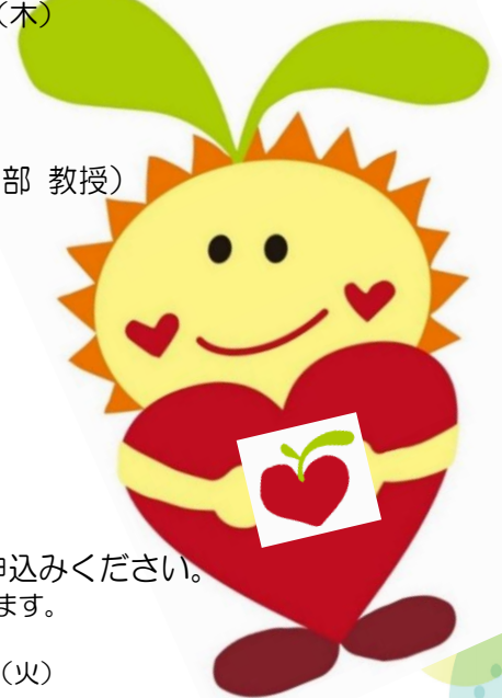
三重県里親啓発公認キャラクター 「みえさとちゃん」