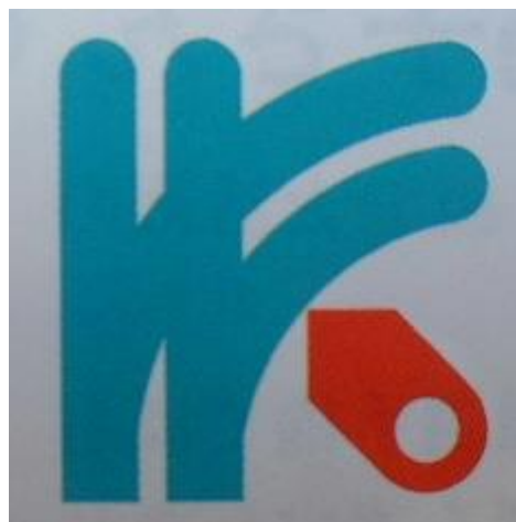
適正計量管理事業所の標識