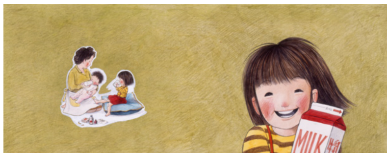
林明子《はじめてのおつかい》表紙・裏表紙原画