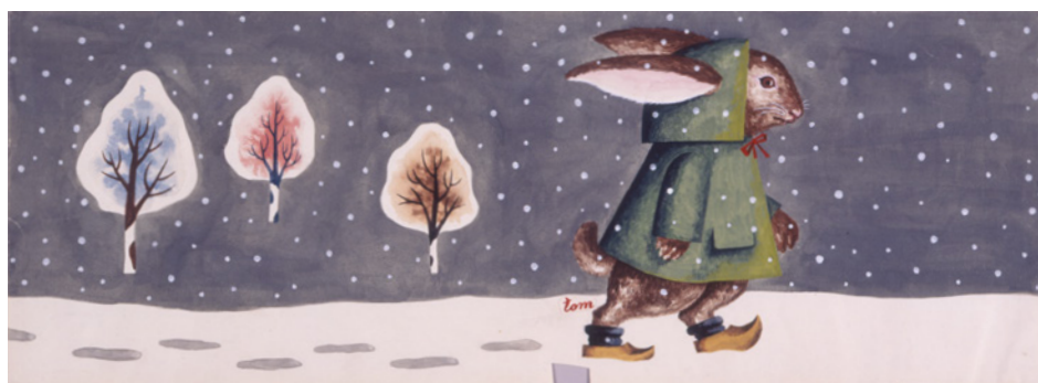
村山知義《しんせつなともだち》表紙・裏表紙原画