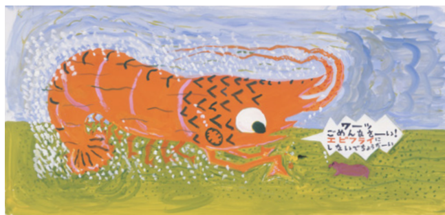
長新太《なんじゃもんじゃはかせのおべんとう》18-19頁原画