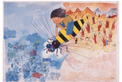
池田龍雄《ろくとはちのぼうけん》18-19頁原画