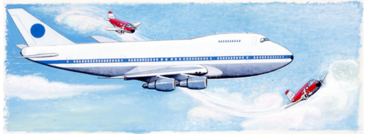
山本忠敬《とべ!ちいさいプロペラき》表紙・裏表紙原画