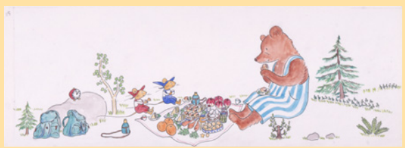
山脇百合子《ぐりとぐらのえんそく》30-31頁原画