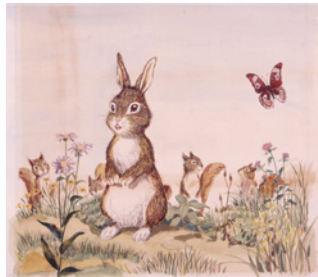
太田大八《がらんぼ-ごろんぼ-げろんぼ》表紙・裏表紙原画