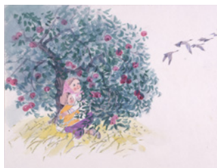
佐藤忠良《ババヤガーのしろいとり》26-27頁原画