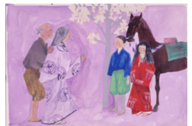
朝倉摂《すねこ・たんぼこ》18-19頁原画