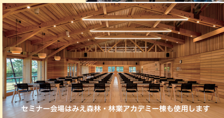
セミナー会場はみえ森林・林業アカデミー棟も使用します

NPO 法人サウンドウッズ 大阪事務所：大阪市中央区内平野町 2-1-2-5A 〒540-0037