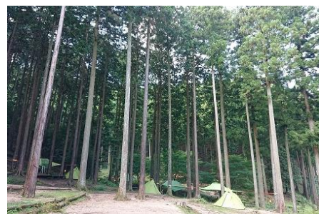
かぶとの森テラス