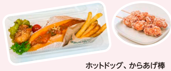
ホットドッグ、からあげ棒