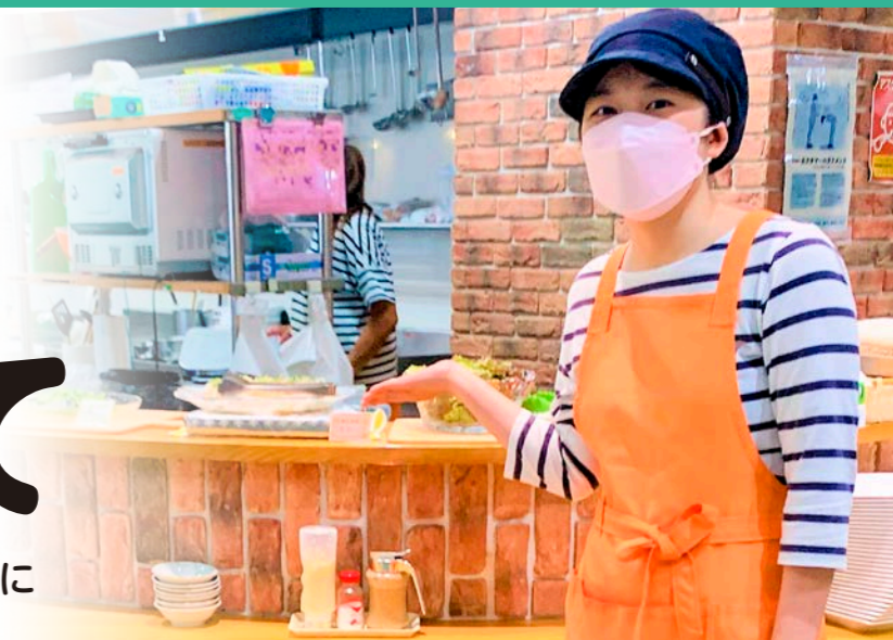
だいたい食堂 (津市)