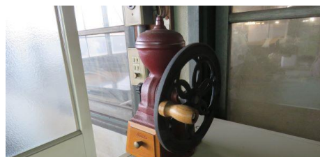
鋳鉄鋳物製コーヒーミル