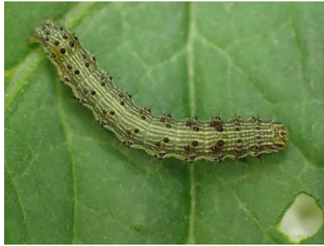
写真1 オオタバコガ幼虫