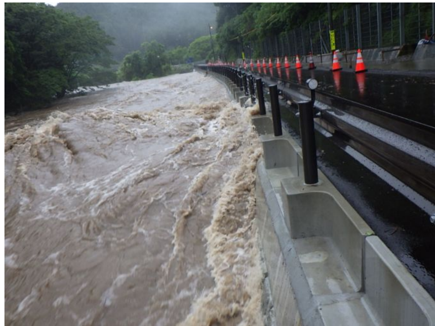
対策後の状況(河川が増水しても道路が冠水せず通行可能)