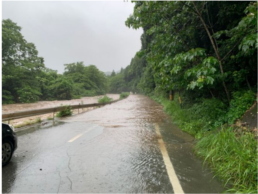
対策前の状況(河川の増水に伴い道路が冠水し通行不能)