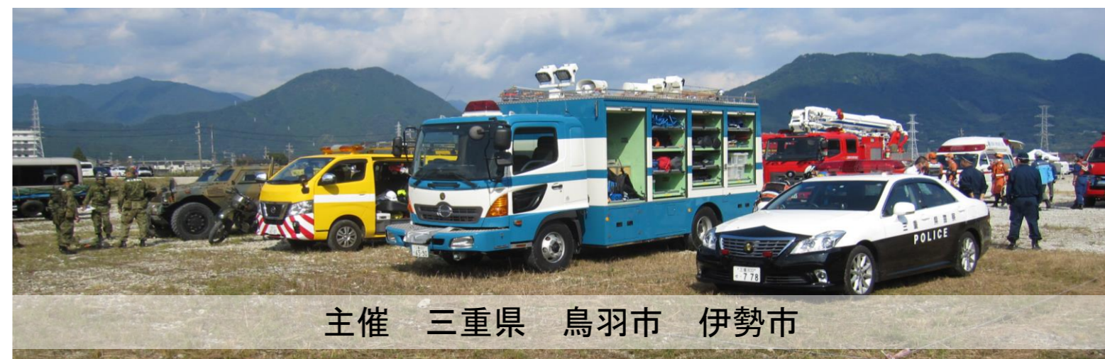
主催 三重県 鳥羽市 伊勢市