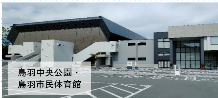
鳥羽中央公園・鳥羽市民体育館