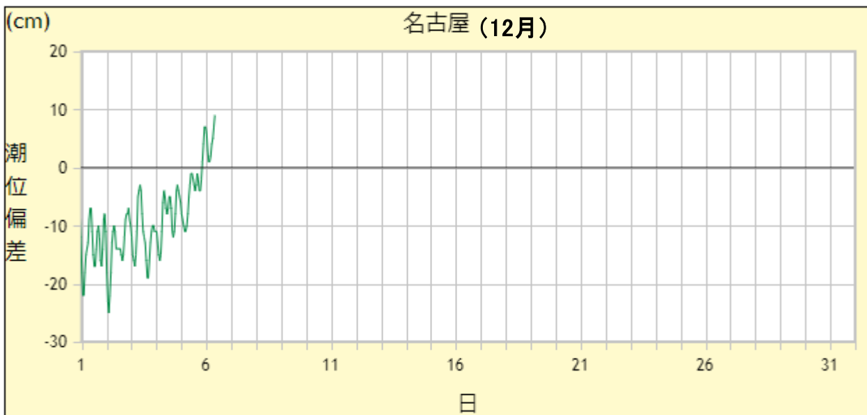
【名古屋港の潮位偏差(速報値)】